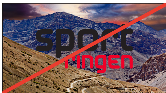
Placerad mot bild eller rörig bakgrund